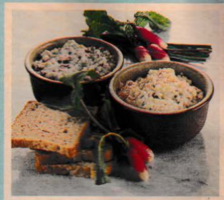
Sommersalat og skinkesalat Opskrifter side 13 i Brugsens Slankebog. Se Forbrugersiden s. 52-53.