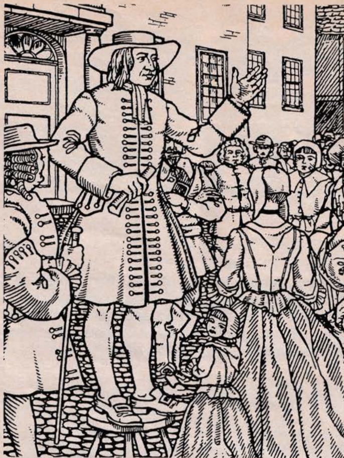
◀ Kvækerbevægelsens grundlægger George Fox rejste rundt i 1600-tallets England og udbredte sine ideer (tegning fra et kvækerskrift).

Fredsarbejdet er nok det mest fremtrædende fælles træk ved Vennernes Samfund overalt i verden. De fleste kristne ville ønske, at